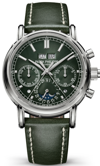
Chronographe à rattrapante et quantième perpétuel.

La montre-bracelet Grande Complication référence 5204 est le premier chronographe à rattrapante et quantième perpétuel Patek Philippe équipé d'un mouvement intégralement développé et fabriqué dans les ateliers de la manufacture. Doté d'une architecture classique avec remontage manuel, embrayage horizontal et deux roues à colonnes, ce calibre CHR 29-535 PS Q se démarque par de nombreuses avancées techniques, dont six innovations brevetées pour le mouvement de base. Il se distingue également par un mécanisme de rattrapante entièrement retravaillé et optimisé